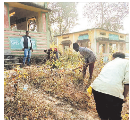
पलटन घाट की सफाई करते कर्मचारी।

शहर सीमा से लगभग एक किलोमीटर जिले का प्रमुख पर्यटन स्थल पलटन घाट नववर्ष के आगमन पर नगर पालिका अध्यक्ष ने लिया साफ-सफाई का जायजा