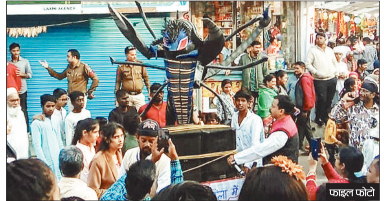
हरिभूमि न्यूज | मनेन्द्रगढ़

विदा ले रहे वर्ष को यादगार बनाने और नववर्ष के स्वागत को सांस्कृतिक उल्लास से भरने के उद्देश्य से मनेन्द्रगढ़ में बहुरूपिया महोत्सव का भव्य आयोजन 31 दिसंबर को किया जा रहा है। इस रंगारंग आयोजन का संयोजन सांस्कृतिक मंच मनेन्द्रगढ़ द्वारा किया जा रहा है। इसमें क्षेत्र के साथ-साथ दूर-दराज से आए कलाकार अपनी अनोखी कला और पारंपरिक वेशभूषा से दर्शकों का मन मोहेंगे।