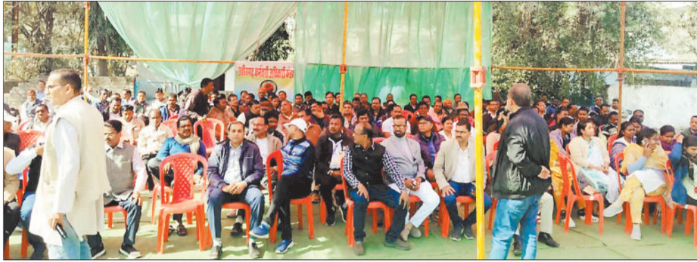
धरना स्थल पर बैठे अधिकारी-कर्मचारी फेडरेशन के सदस्य।

महंगाई भत्ता समेत 11 सूत्रीय मांगों को लेकर कर्मचारी-अधिकारी फेडरेशन की हड़ताल से सरगुजा में काम काज टप गया है। हड़ताल के कारण शासकीय कार्यालयों में ताला लटका रहा और काम प्रभावित रहा। हड़ताल के कारण दूर दराज के ग्रामीण क्षेत्रों से आए लोगों को खासी परेशानी का सामना करना पड़ा। इस दौरान फेडरेशन ने अपनी मांगों को लेकर धरना प्रदर्शन करने के साथ ही सरकार पर जमकर हमला बोला और मोदी की गारंटी के तहत घोषणापत्र में किए गए वादों को पूर्ण करने की मांग की। बता दें कि केंद्र के समान महंगाई भत्ता प्रदान करने सहित 11 सूत्रीय मांगों को लेकर कर्मचारी अधिकारी फेडरेशन द्वारा चरणबद्ध आन्दोलन किया जा रहा है। आन्दोलन के तहत फेडरेशन ने मोदी की गारंटी के तहत चुनाव के दौरान किए गए वादों को पूर्ण करने की मांग को लेकर फेडरेशन ने ज्ञापन सौंपने के साथ ही सामूहिक अवकाश लेकर तीन दिवसीय हड़ताल की चेतावनी दी थी। इसी कड़ी में सोमवार को कर्मचारी अधिकारी फेडरेशन के बैनर तले शासकीय